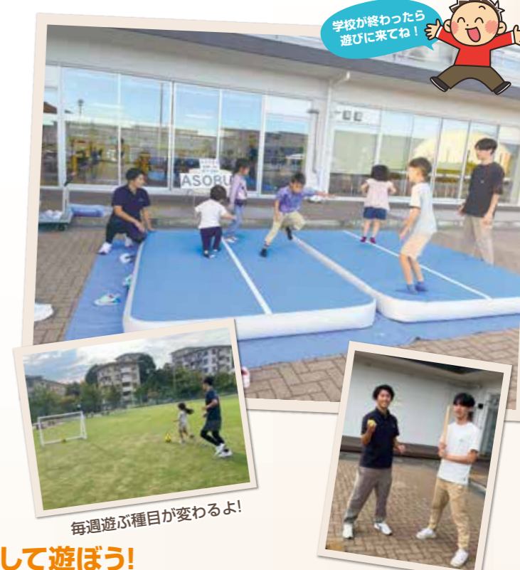
毎週遊ぶ種目が変わるよ!