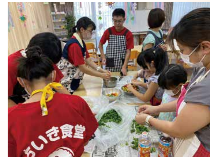
ボランティアと一緒に食事の準備

「久しぶりだね～」と親しげに集うシニアや親子連れ。多世代の人たちが集う、ちいき食堂「厨」。岩成台にあるデイサービス「ミルクホール」の休日を活用し、6月からスタートしました。「食事で人と人とをつなぐ」をコンセプトに毎月第3日曜日に開催しています。最近ではロコミなどで来所者も増え、1食100円で提供される限定50食の食事も完売するといいます。スタッフは全てボランティアで運営されています。