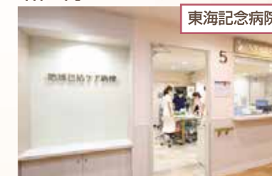
病床の半分近くが地域包括ケア病棟です

※急性期病院とは、急な病気や怪我などで重症で緊急に治療が必要な場合、入院や手術、検査などの高度で専門的な医療を行う病院です。簡単に言えば、病気や怪我をした際に一番初めに運ばれる病院のことです。