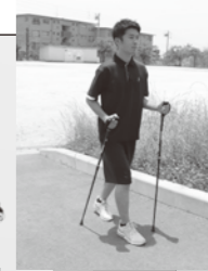
協力:中部大学スポーツ保健医療学科 尾方教授