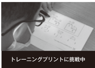
トレーニングプリントに挑戦中

◎完全個別で読み書き計算学習をします。苦手な課題はトレーニングプリントで補えるように進めていきます。早いうちから取り組むことをお勧めします。