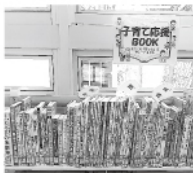
①子育て応援BOOKコーナー

子育てをひと段落した先輩の方からも、ご応募お待ちしております。ぜひ、お立ち寄りください。