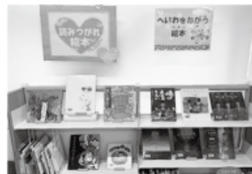
③読みつがれ絵本、季節の絵本