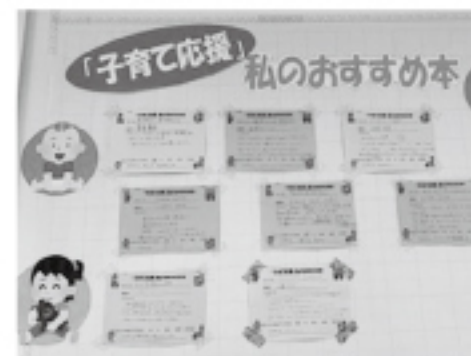
②子育て応援・私のおすすめ本 募集