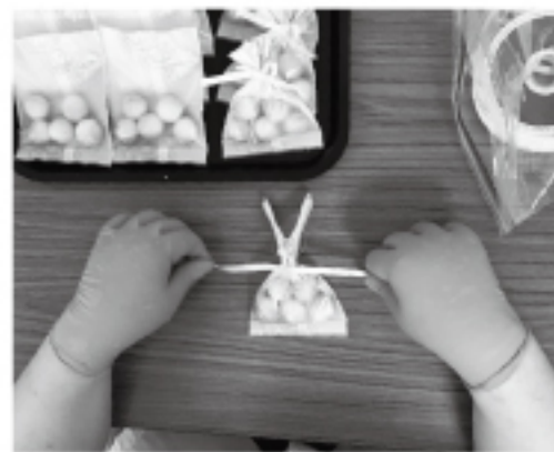
就労支援事業所タウンジョブズの皆さんが最後の仕上げをしています。