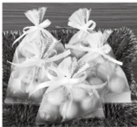
10周年記念! 「アーモンドコロ(レモン)」発売中です。

「アーモンドコロ(レモン)」は5月下旬から1階 café Fujitoにて本格販売が始まっています。市役所での元気ショップの販売商品にも加わっています。5個入160円(税込)。是非タウンジョブズのスイーツ班が作る新製品を味わってください。