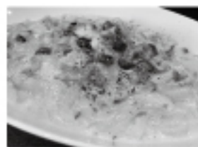
シーフードのトマトクリーム