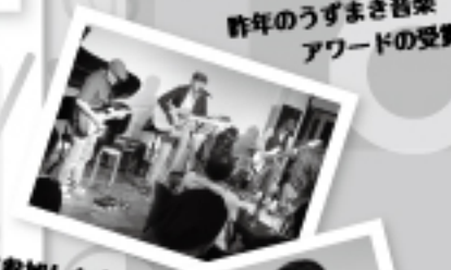
初めて参加した人あり

次回のエンタリライブ開催は6月15日(土)。 次々回(7月20日(土))開催のエンタリライブは6月1日(土)からエンタリ開始します。歌・ピアノ・楽器など、どなたでもエンタリできます!子どもおとなもOK! 福祉枠もあるのでお問い合わせください。