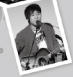
バンドやソロあり

お申込みお問い合わせは ▶グルッポイベント事務局 (NPO法人 まちのエキスパネット) Tel:0568-37-2933 http://expanet.jp