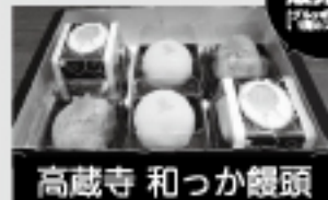
高蔵寺 和っか饅頭

3種類6個入り 1500円(税込み) 【高蔵寺】「高蔵寺」(グルッポふじとう) ※冷凍保存できます。