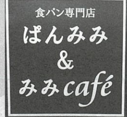
黄色い看板が目印