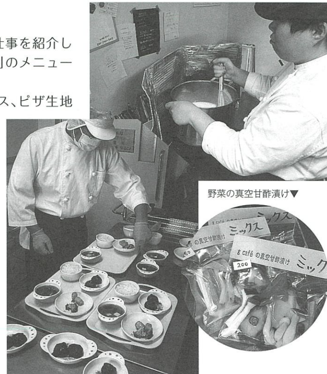
野菜の真空甘酢漬け▼

最近では、カフェで販売するパンを仕上げ焼き、袋詰めをする仕事や、新商品の試作なども仕事に加わりました。こうして、できることが増え、「藤東ジョブズ」の皆さんはカフェに無くてはならない存在になっています。