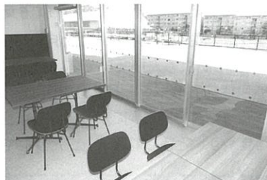
■グルッポふじとうニュースでは、コミュニティカフェ (g café Fujito たまりばルーム、えんがわルーム、ギャラリー) の楽しみ方、使い方をお伝えしていきます。